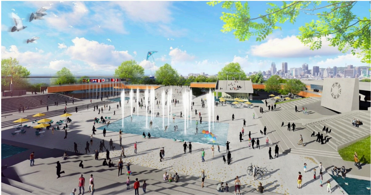
Vision de la Société du parc Jean-Drapeau pour la Place des Nations.